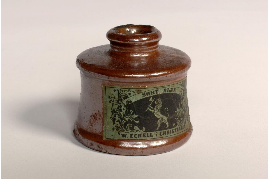
Ivar Aasens blekkhus.