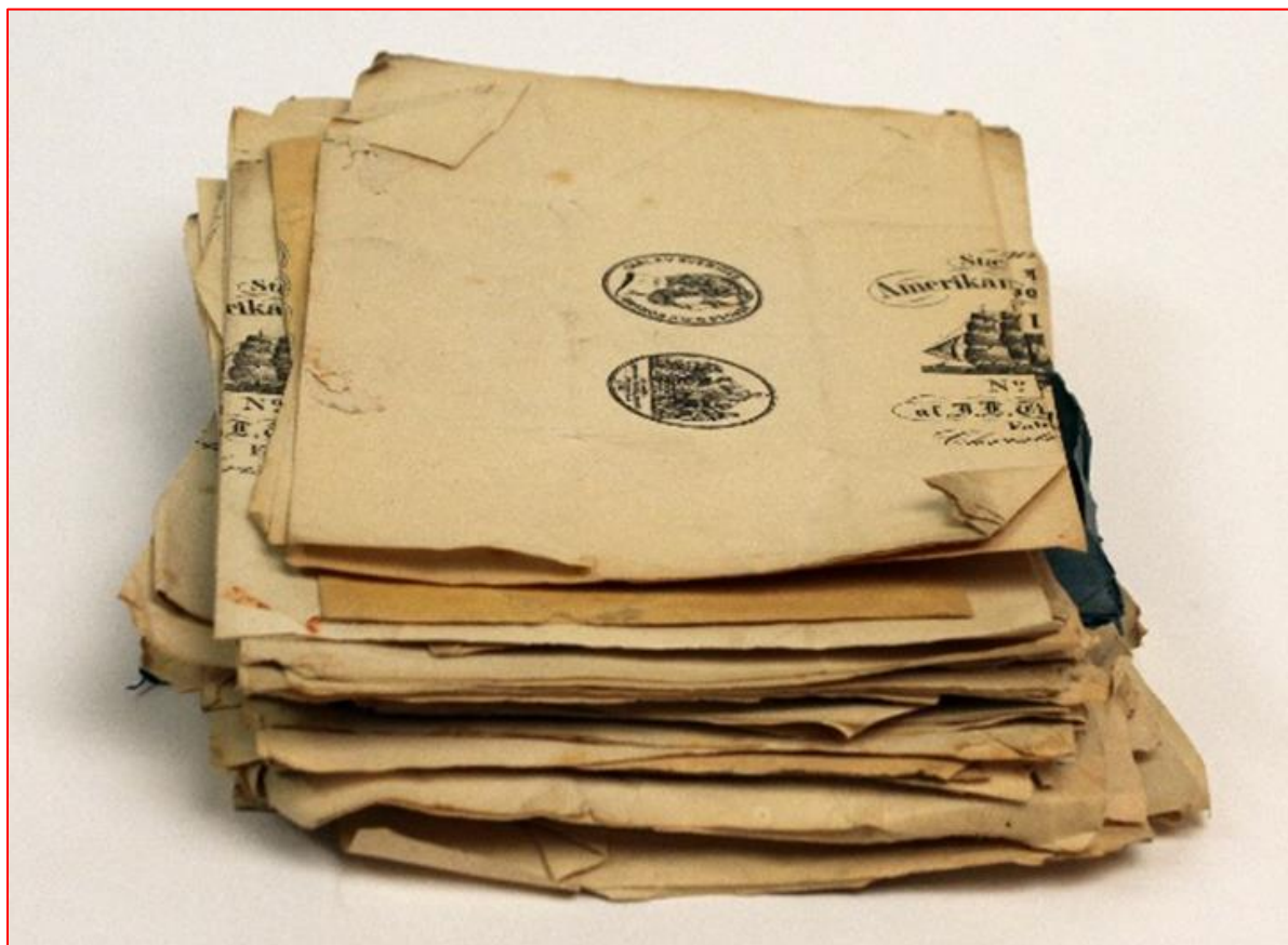
Ubrukt skrivepapir etter Ivar Aasen.