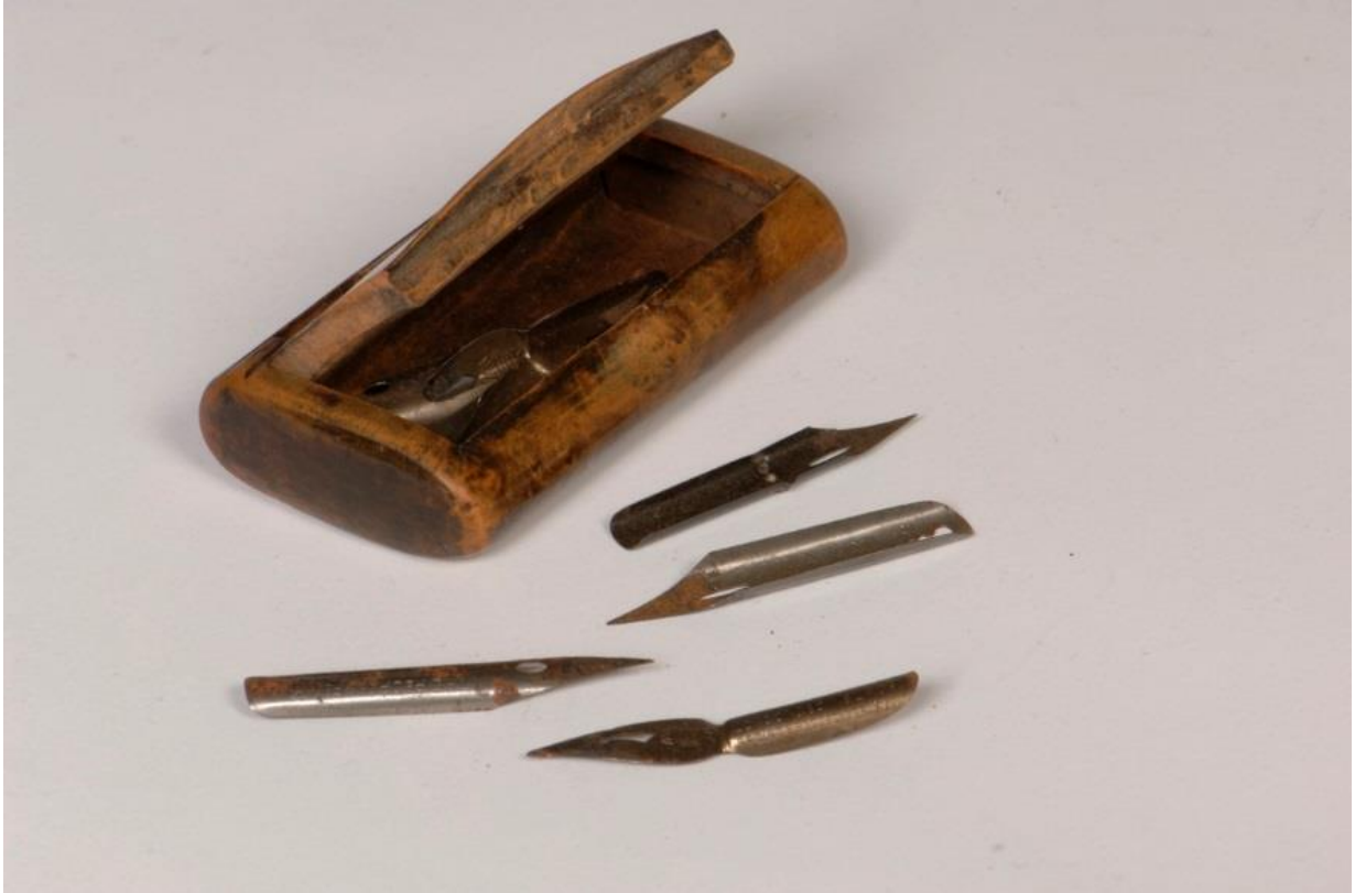
Ivar Aasens pennesplittar.