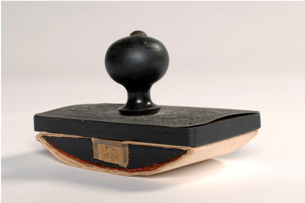
Ivar Aasens trekkpapir.