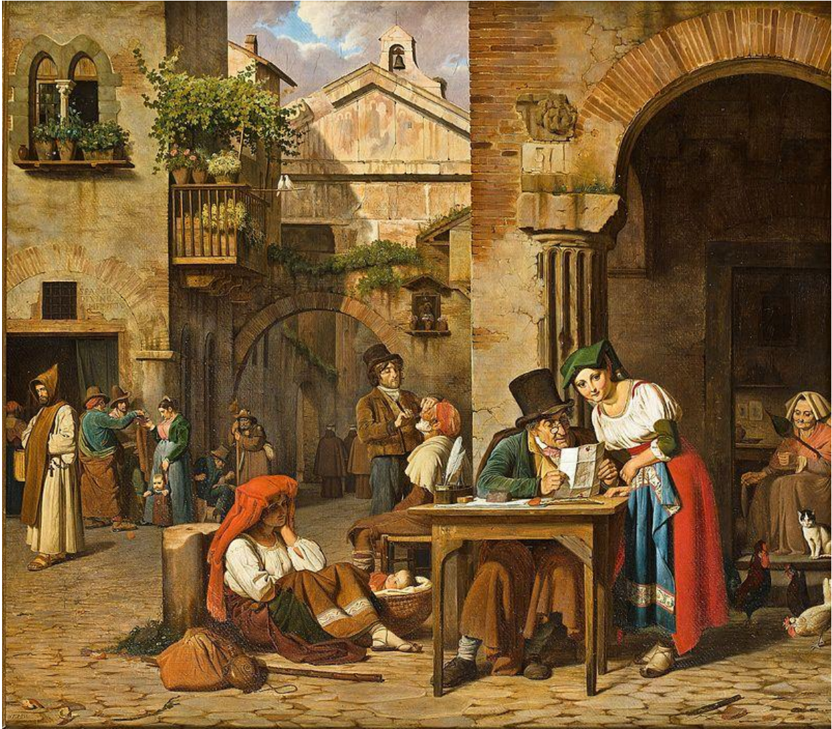
Ernst Meyer: «En romersk gadeskriver læser et brev for en ung pige», 1829, Thorvaldsens Museum, København.