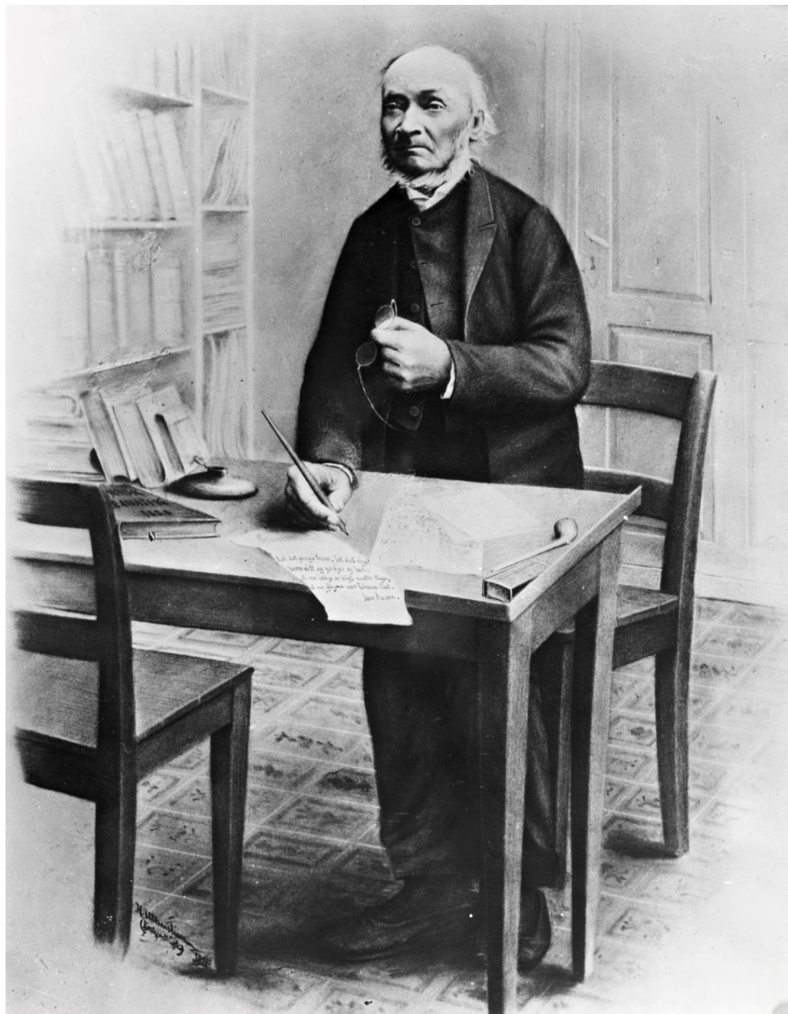
Hans Uthusliens portrett av Ivar Aasen frå 1891.