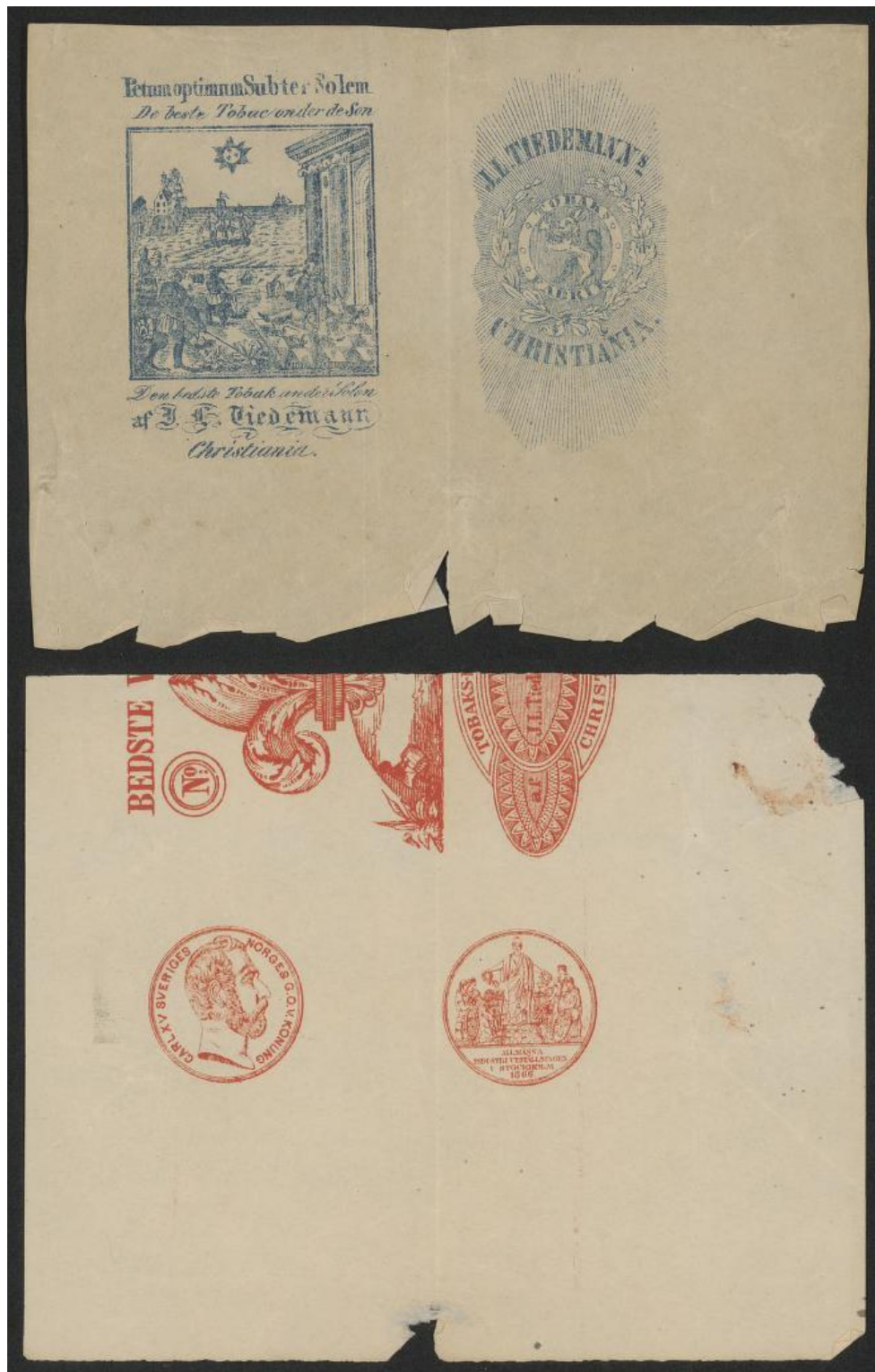
Ubrukt skrivepapir, emballasje for tobakk. Ms 4° 915: 17, Nasjonalbiblioteket, s. 341 og 370 i digital versjon.